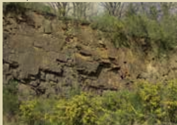
Vue de l'ancienne carrière à cornéennes de La Courbe.

Très résistantes, ces roches sont utilisées de longue date pour la construction de remparts et d'habitations. Celles du bourg de La Courbe en sont un bon exemple.