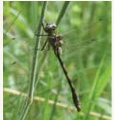
Cordulie à corps fin.

La loutre d'Europe est sans doute la plus emblématique. Elle fréquente régulièrement les berges tranquilles et sauvages des méandres de l'Orne.