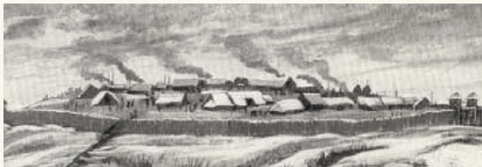
Représentation d'un oppidum, servant à la fois de défense et de refuge pour les gaulois.

À l'instar du site de Bierre (situé à Merri dans l'Orne), il s'agit d'un camp fortifié de hauteur (ou oppidum), de la grande famille des éperons barrés.