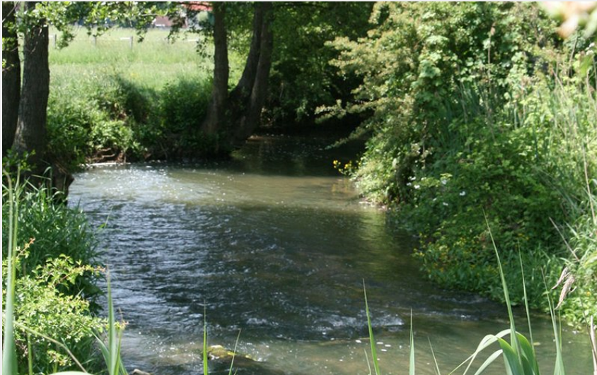
Pâtures argentan (Mairie d'Argentan)