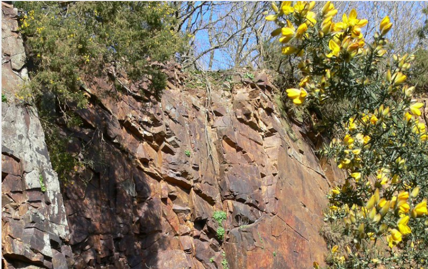
Méandres de l'Orne, La Carrière, Espace Naturel Sensible de l'Orne (CD61)