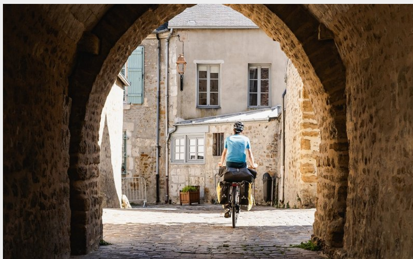
Porte Saint-Denis à Mortagne-au-Perche (Un Monde à Vélo, La Véloscénie)