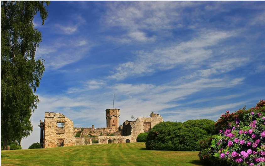
Mont de Cerisy-Belle-Etoile, Orne (Jean-Eric Rubio)