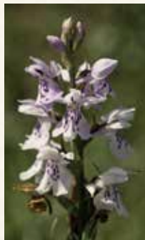
La Dactylhorize de Fuchs ►

Aujourd'hui, la prairie du Souvenir est aussi un lieu favorable à la biodiversité. Avec la pratique de la «fauche tardive», les plantes ont le temps de pousser et de se reproduire, tout en offrant nourriture et refuge à la faune. Ici 9 espèces différentes d'orchidées sauvages se développent.