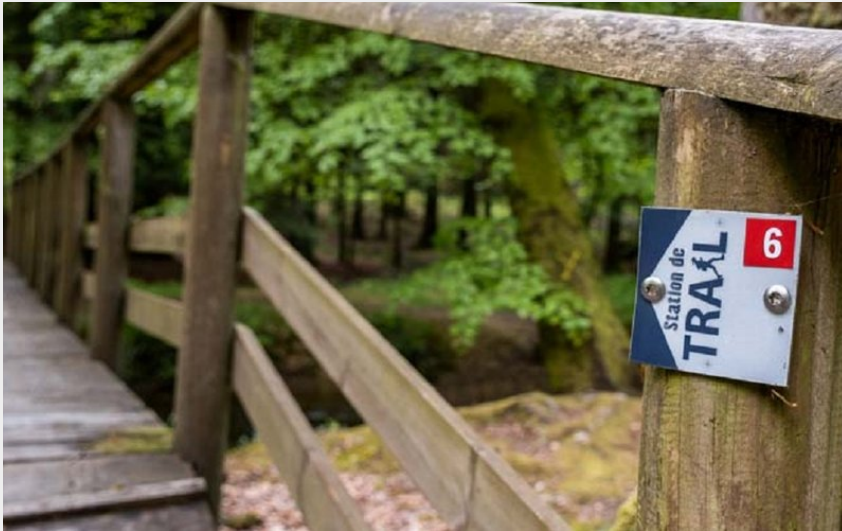
Station de Trail® Massif d'Ecouves