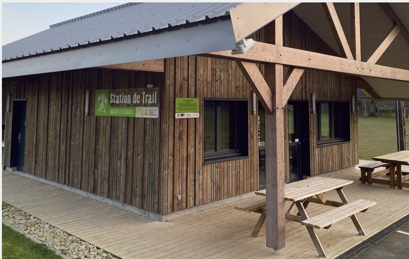
Station de Trail® Massif d'Ecouves (Tourisme 61)