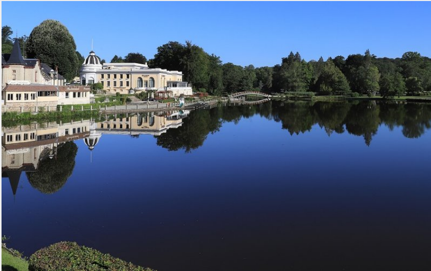
Bagnoles de l'Orme Normandie (Jean-Eric Rubio)