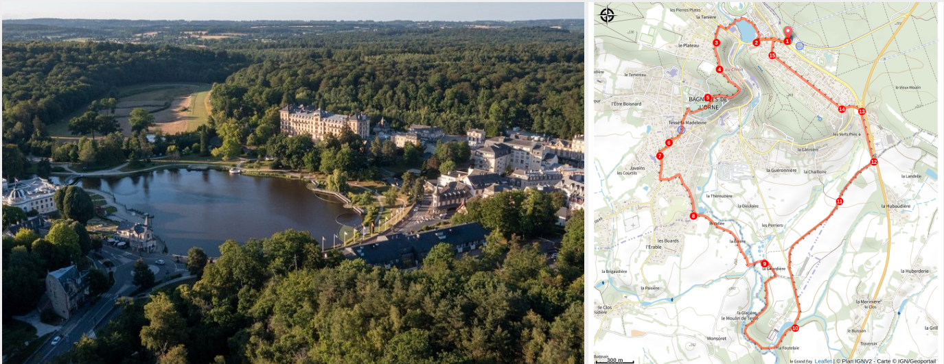
Station thermale de Bagnoles de l'Orne Normandie

Cette boucle de 8,7 km vous emmène à la découverte des plus beaux paysages et du patrimoine de la station thermale de Bagnoles de l'Orne Normandie. Entre le belvédère du Roc au Chien, le parc du château, le Quartier Belle Époque, le casino du Lac et le château de Couterne, la randonnée alterne avec nature, histoire et panoramas.