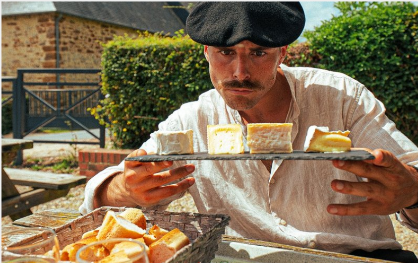
Dégustation de Camembert, à Camembert (Les Moustachus en Vadrouille)