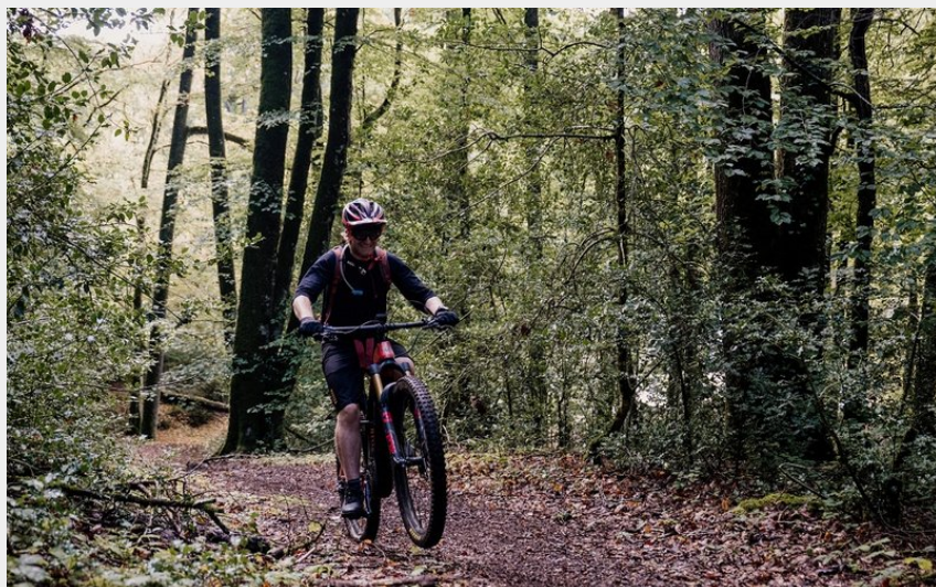
VTT dans l'Orne