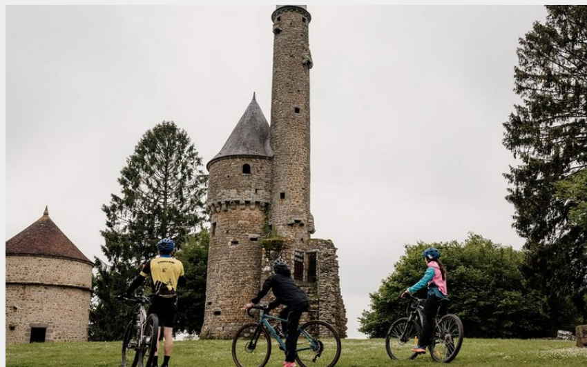
VTT, Tour de Bonvouloir