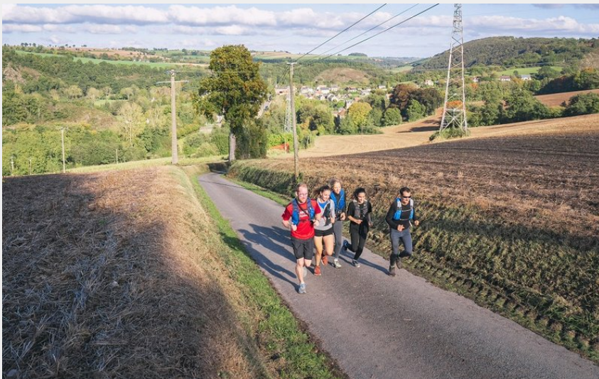
Sur les hauteurs de Saint-Pierre-du-Regard en Suisse Normande (Le 7ème Studio)