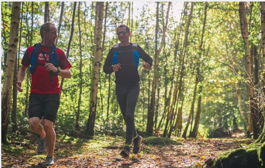
Trail en Suisse Normande (Le 7ème Studio)