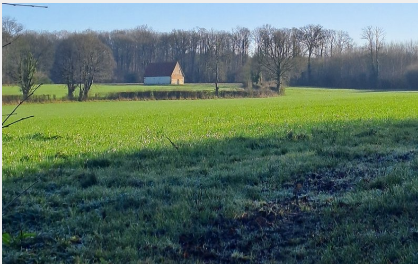
La Chapelle Saint Blaise, Pays d'Ouche (CDC des Pays de l'Aigle)