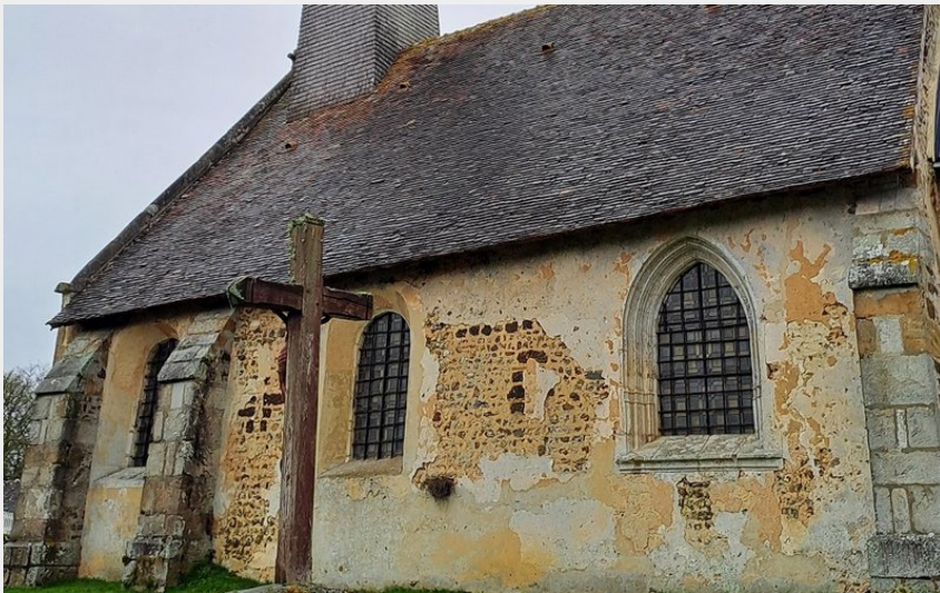
Chapelle Saint-Pierre de Sommaire, Pays d'Ouche (CDC des Pays de L'Aigle)