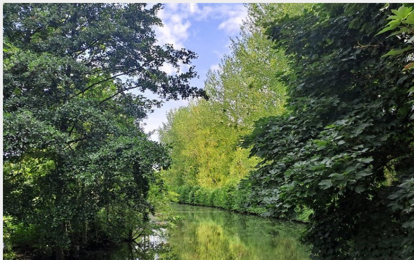
L'Iton, Chandai (CDC des Pays de l'Aigle)