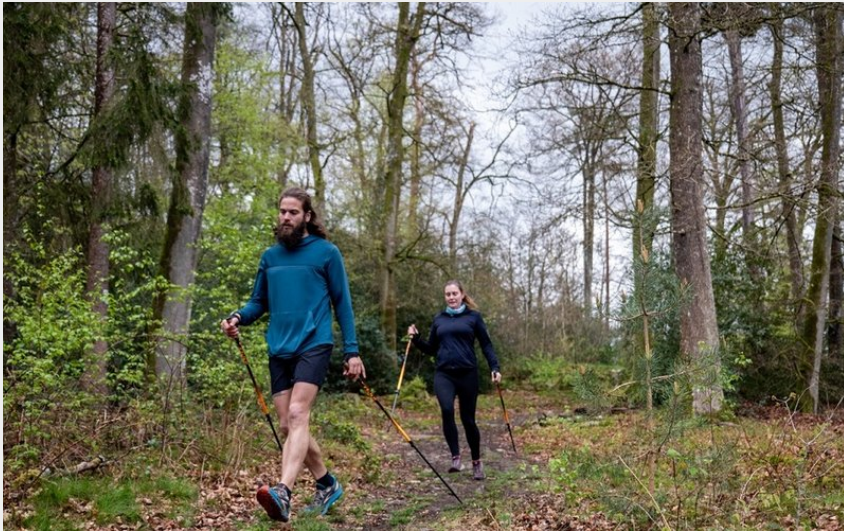
Marche Nordique en forêt des Andaines, dans l'Orne