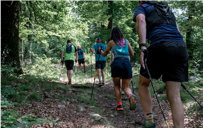
Marche Nordique en forêt des Andaines, dans l'Orne