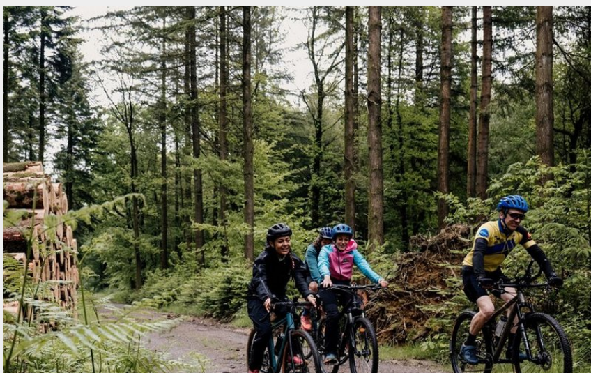
Gravel en forêt des Andaines, dans l'Orne