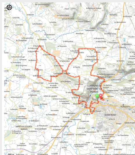
Trail autour de Domfront-en-Poiraise avec Sylvaine Cussot

Partez explorer la campagne Domfrontaise au départ de la ville médiévale de Domfront-en-Poiraise. Un parcours composé essentiellement de chemins de terre.