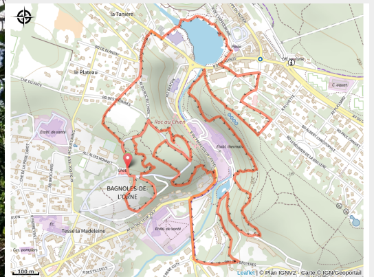
Parcours d'entraînement à Bagnoles de l'Orne Normandie

Envie de s'entraîner avec du dénivelé positif dans un endroit agréable ? Cette boucle est idéale. A réaliser autant de fois que souhaité !