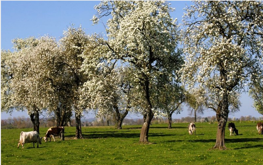
Paysage du bocage domfrontais dans l'Orne (Tourisme 61)