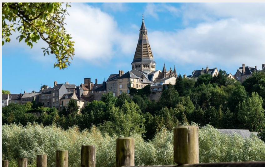
Point de vue sur Domfront-en-Poiraise (D. Commenchal)