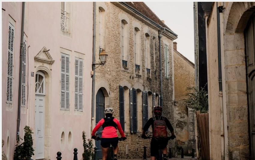
Bellême à VTT (Thomas Le Floch)