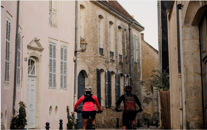
Bellême à VTT (Thomas Le Floch)