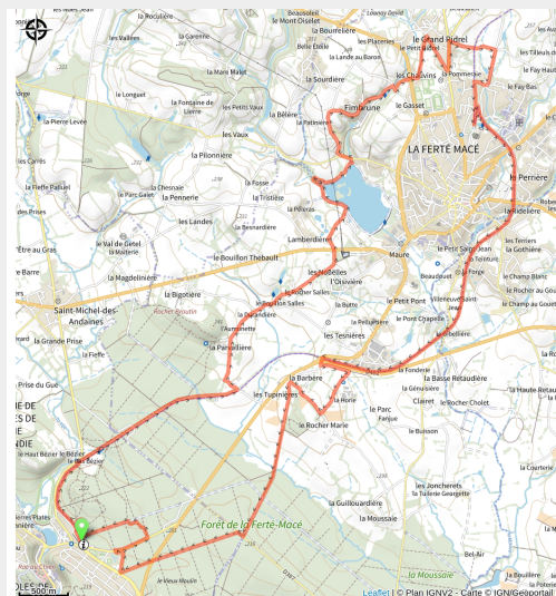
Gravel en forêt domaniale des Andaines dans l'Orne (Tourisme 61)

Pour les amateurs de Gravel à la recherche de nouveaux défis, ce circuit offre une belle découverte de la pratique !