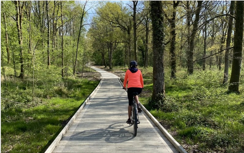
Gravel en forêt domaniale des Andaines dans l'Orne