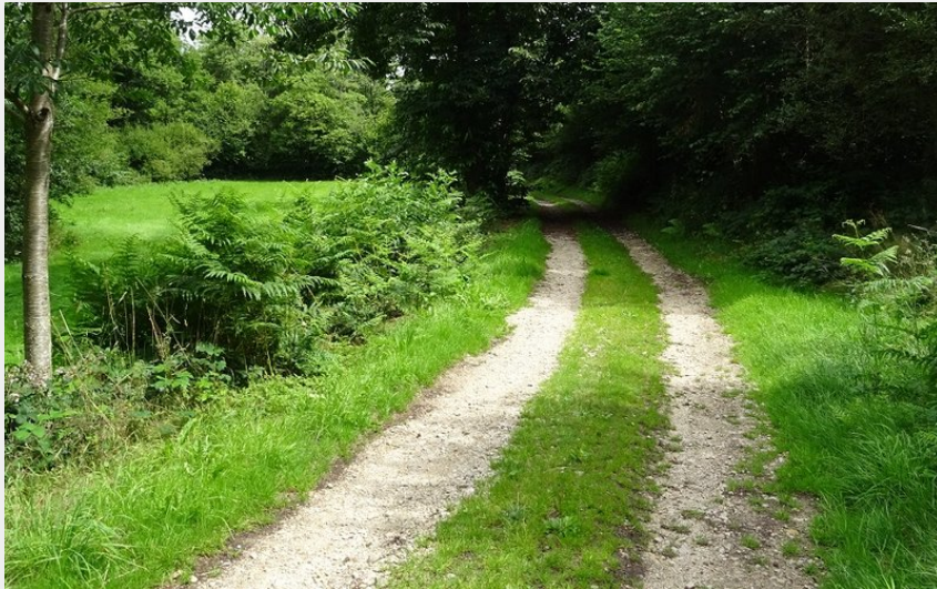
Chemin de randonnée (TOURISME 61 - P. PEIGNEY)