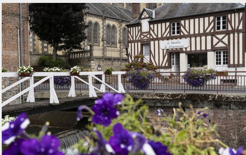
Vue sur le centre-ville de Vimoutiers dans l'Orne (Danielle DUMAS)