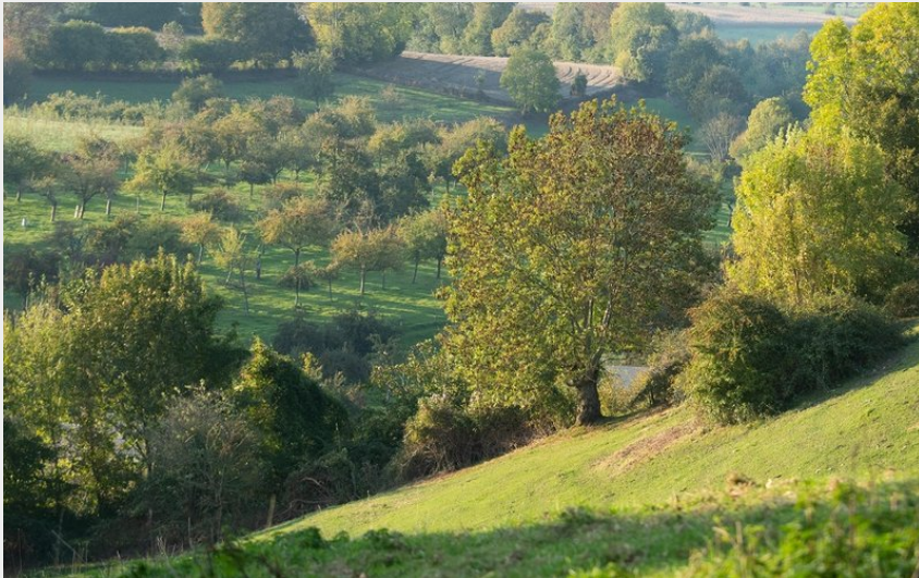
Paysage du Pays d'Auge Ornaïs (D. Commenchal)