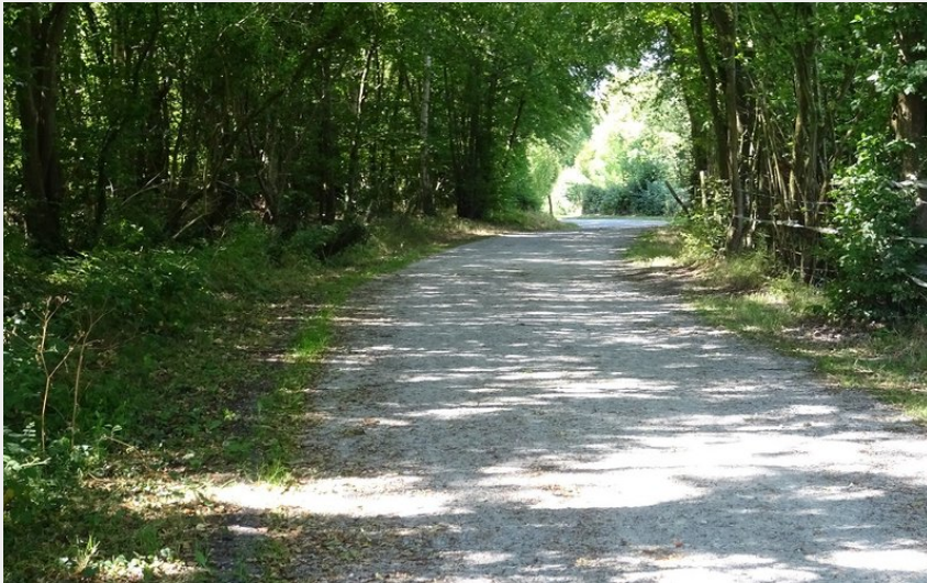
Voie verte de la Risle