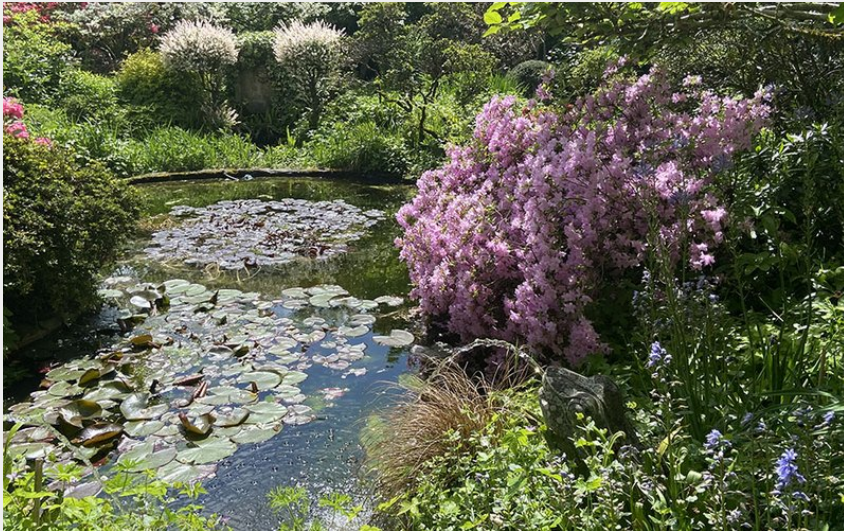
Jardins de la petite Rochelle à Rémalard