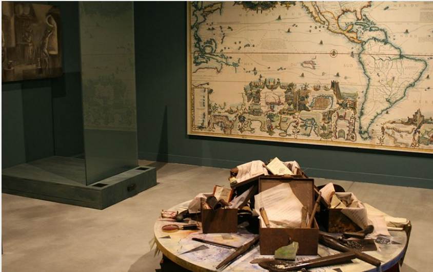
Muséales de Tourouvre