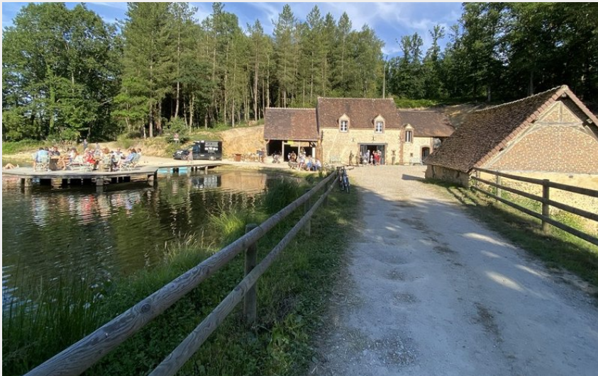
La Brasserie du Perche (Brasserie du Perche)