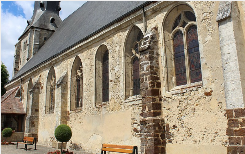
Eglise de Tourouvre-au-Perche