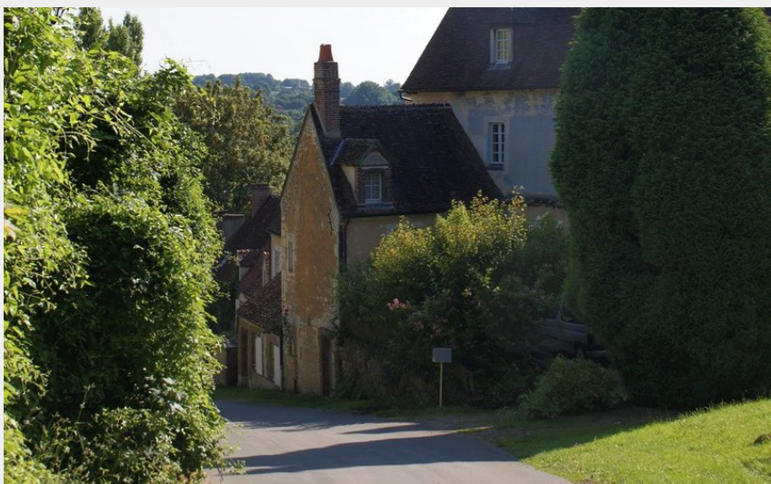
Hameau de Villeray à Condeau dans le Perche (Tourisme 61)