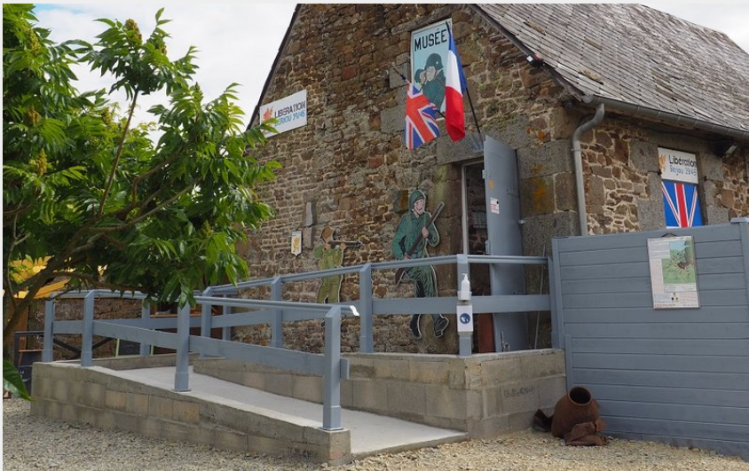
Musée de la libération de Berjou, Suisse Normande (Morgan Bourbon)