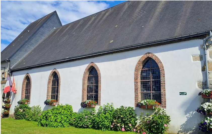
Mairie, Les Aspres (OT L'Aigle)