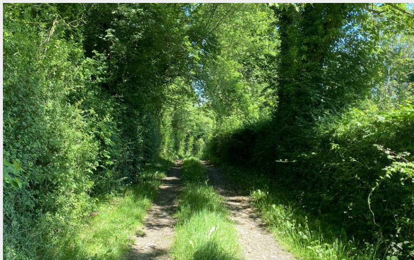
Chemin de randonnée dans l'Orne