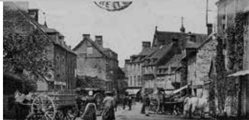
La Carneille, un jour de marché (market day)