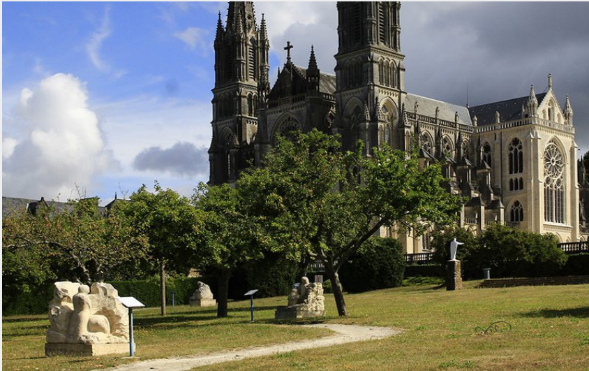
La Chapelle Montligeon (JE Rubio)