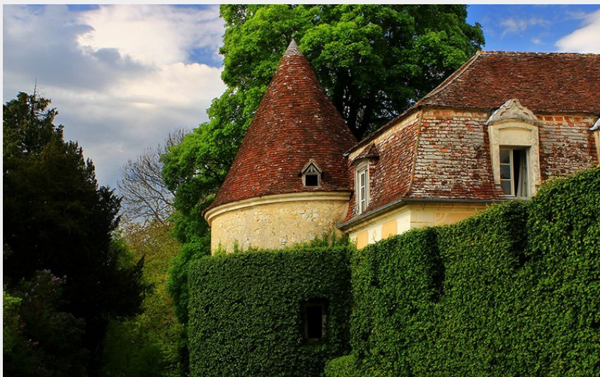
Manoir de Maison Maugis (JE Rubio)