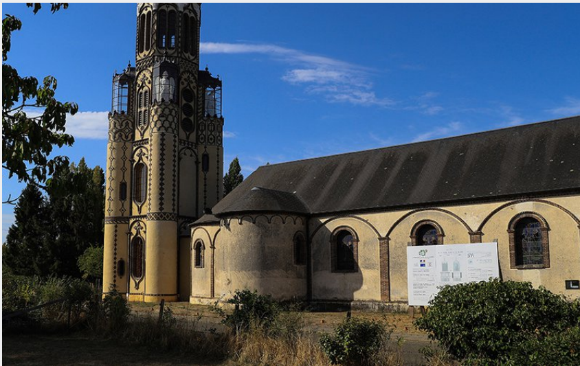
Eglise de Malétable