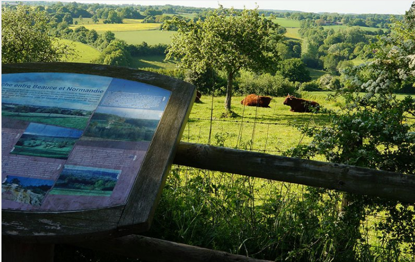
Site de l'Eperon à La Perrière