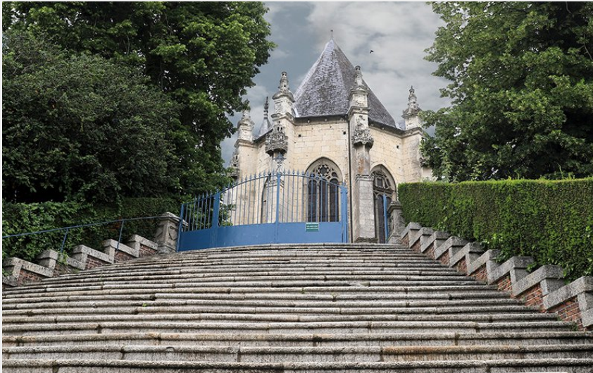
Longny au Perche Notre Dame de la Pitié