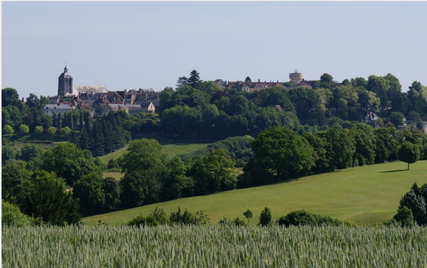
Bellême (Tourisme 61)