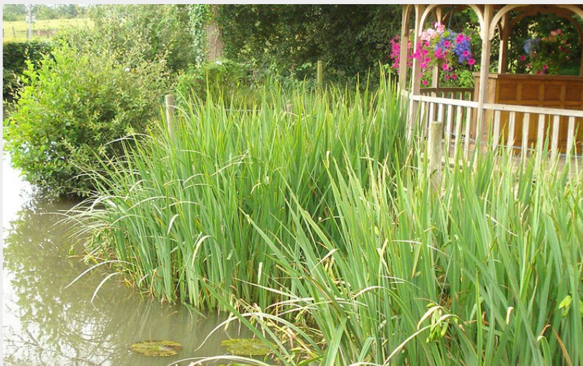
Feing (Tourisme 61)