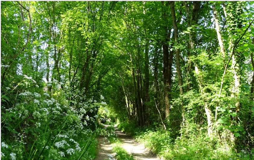
Chemins du Pays Mélois, Orne