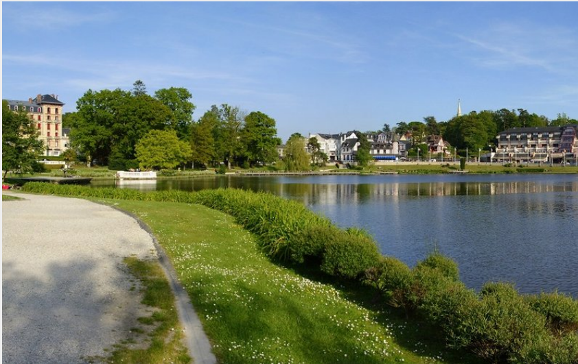
Bagnoles de l'Orne Normandie (Jean-Eric Rubio)