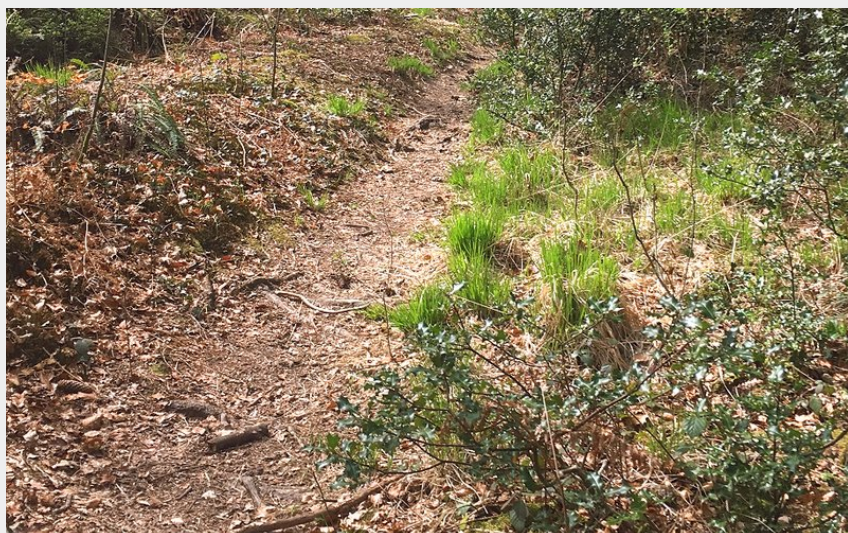
Station de Trail® Bagnoles Normandie (Tourisme 61)